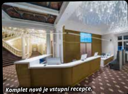
Komplet nová je vstupní recepce.