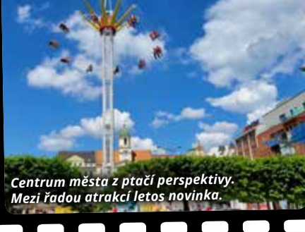
Centrum města z ptáčích perspektivy. Mezi řadou atrakcí letos novinka.