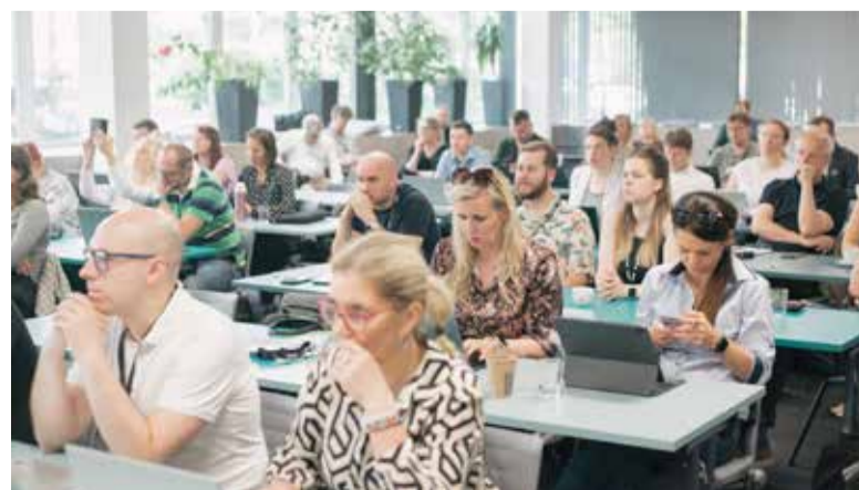
V Ústí se setkala na 70 zástupců inovačních center a rozvojových agentur, které ve svých krajích realizují regionální inovační strategie (RIS).