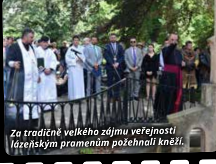
Za tradičně velkého zájmu veřejnosti lázeňským pramenům požehnali kněží.