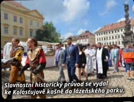
Slavnostní historický průvod se vydal ke Kolostujově kašně do lázeňského parku.