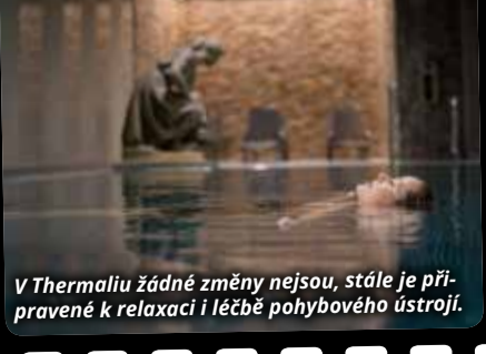
V Thermalii žádné změny nejsou, stále je připravené k relaxaci i léčbě pohybového ústrojí.