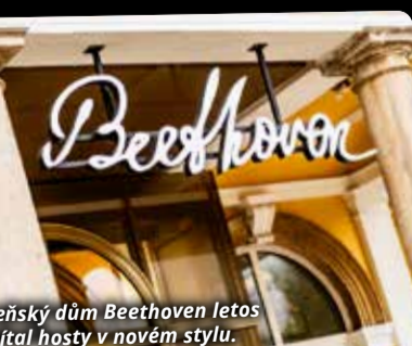
Beethovenův dům Beethoven letos vítal hosty v novém stylu.