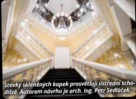
Stovky skleněných kapek prosvětlují ústřední schodiště. Autorem návrhu je arch. Ing. Petr Sedláček.